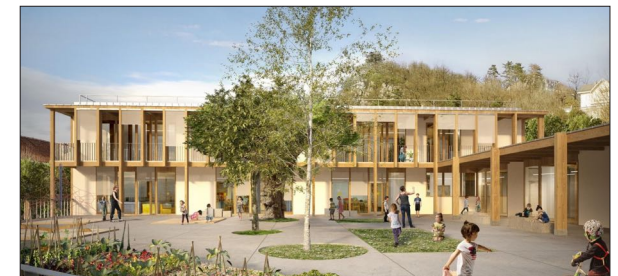
Groupe Scolaire Debelle à Voreppe BRENAS DOUCERAIN Architectes