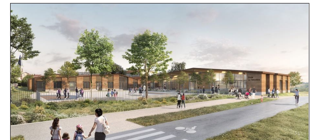
Ecole élémentaire à LA TALAUDIÈRE ATELIER DES VERGERS Architectes

Construction d'un restaurant scolaire 500 repas Mission Archigram : Pré-programme, Programme technique, assistance concours.