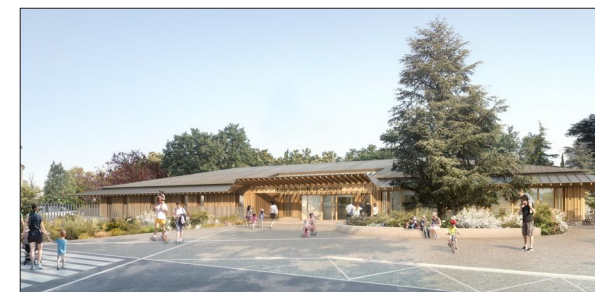
Ecole maternelle à Coublevie GALLET Architectes