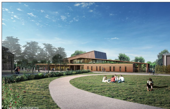
Institut Ste Marie Grand'Grange à St-Chamond AA Group

Conseil Général de la LOIRE (42) 2014 Collège Anne Frank à ST-JUST-ST-RAMBERT Restructuration partielle du collège (demi-pension, pôle scientifique, aménagement de l'entrée...) Mission Archigram : Pré-programme, programme technique