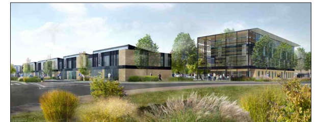
Campus du Beaujolais à Limas CCI Villefranche et du Beaujolais AU*M architectes