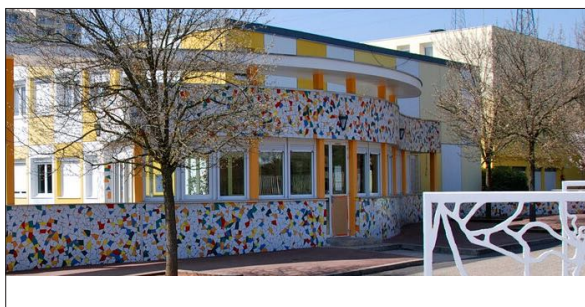
Collège Le puits de la Loire à St-Etienne BRUHAT & BOUVHAUDY Architectes

Conseil Général de la HAUTE-LOIRE (43) 2013 Collège Henri Pourrat à LA CHAISE-DIEU Implantation de l'établissement (80 élèves) sur le site de l'IME Chantelauze Mission Archigram : Pré-programme