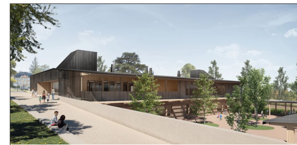
Groupe Scolaire à ARNAS PLAGES ARRIERE Architectes

Restructuration d'une école élémentaire de 10 classes Mission Archigram : Pré-programme