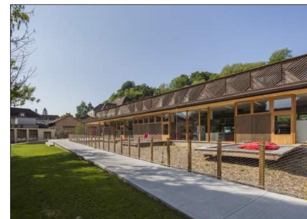
Médiathèque de Pont-de-Beauvoisin Atelier 43

Construction d'un équipement Quartier du Plan médiathèque, espace multi-accueil petite enfance et un centre social.