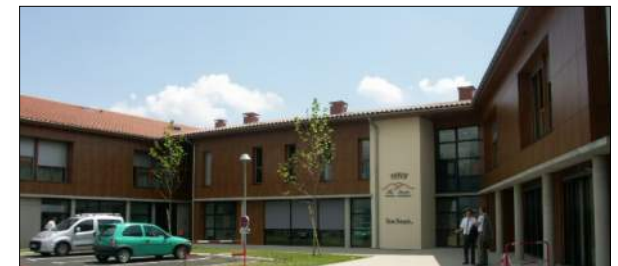
Maison de retraite de St Pal-en-Chalencon J-L. MATHAIS Architecte