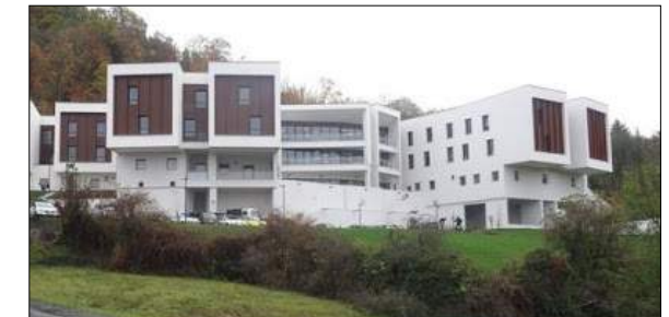
EHPAD au PUY-EN-VELAY CHABANNES