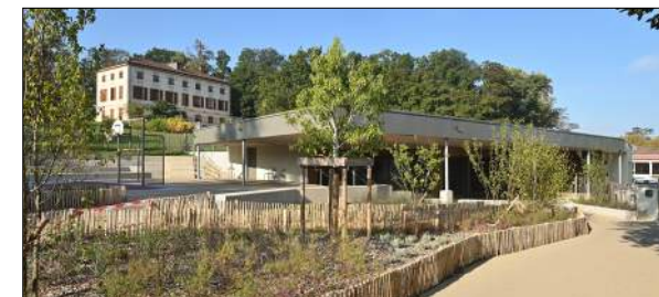
Ecole élémentaire à SAINT-LAURENT-DE-MURE ATELIER JL + ATELIER DES VERGERS

Extension de l'école élémentaire H. Reeves (7 classes et salle polyvalente)