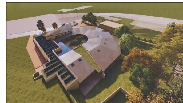
Pôle petite enfance à MONTBRISON Ampère Architecte