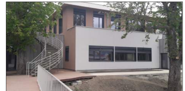
CDAT St Priest en Jarez EQUILIBRE architectes