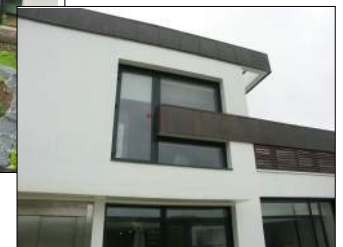
Centre Hospitalier de Blois IVARS ET BALLET Architectes