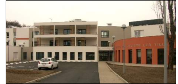
Maison de retraite de La Grand-Croix Groupement Robot-Lanternoz Gallois-Dudzick-Berger

EHPAD de 167 lits, résidence autonomie de 70 lits et 19 logements inclusifs Mission Archigram : Faisabilité SYNERGIE mandataire