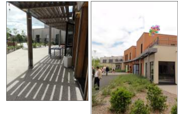
M.A.S. à Chazelles-sur-Lyon CRR Architectes

Implantation de l'internat de 40 enfants dans un bâtiment de logement existant