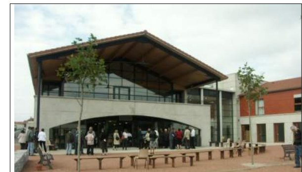
Foyer Les Mûriers à Bussières J.-L. MATHAIS Architecte