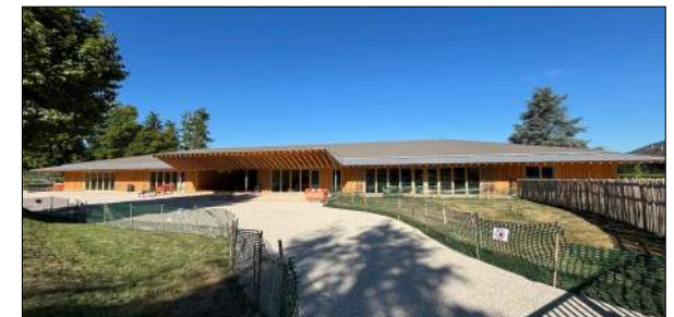
Ecole maternelle à Coublevie GALLET Architectes