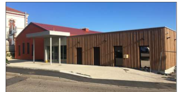
Boulodrome à Saint-Jean-Bonnefond ADMINIMA Architecte