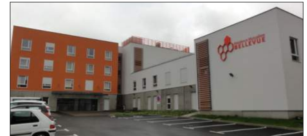
EHPAD BELLEVUE à St Etienne Groupement Eiffage Construction Loire, TECTUM, A2DH