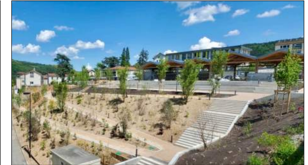
Construction d'une halle à Aurec-sur-Loire

Mission Archigram : Pré-programme, programme technique, assistance choix du maître d'oeuvre