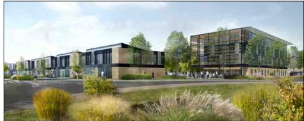
Campus du Beaujolais à Limas CCI Villefranche et du Beaujolais AU*M architectes