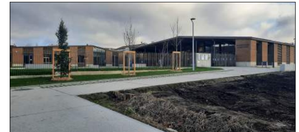
Ecole élémentaire à LA TALAUDIÈRE ATELIER DES VERGERS Architectes

Construction d'une nouvelle école élémentaire (8 classes), restauration (170 élèves) et périscolaire Mission Archigram : Faisabilité, programme technique, Assistance concours