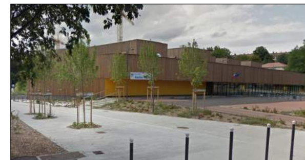
Gymnase P. Chevallier à Rillieux-la-Pape TECTONIQUES Architectes