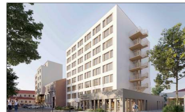
Résidence Autonomie à Grenoble CUYNAT CONSTRUCTION mandataire ATAUB architectes