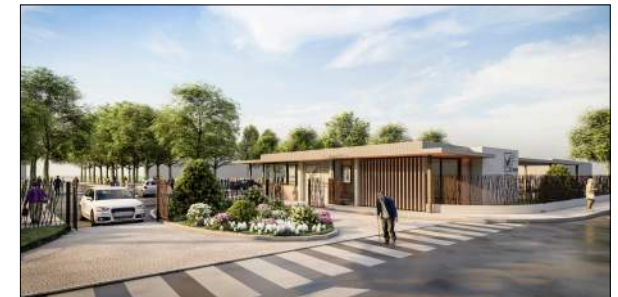
Maison de retraite de la Loire Jean-Luc MATHAIS

Centre départemental de commandement, Etat Major, Codis, CTA, Centre de formation et Centre technique du matériel.