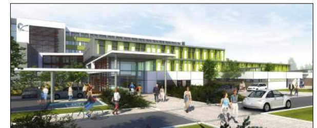
Centre Hospitalier de Vichy CRR Architectes