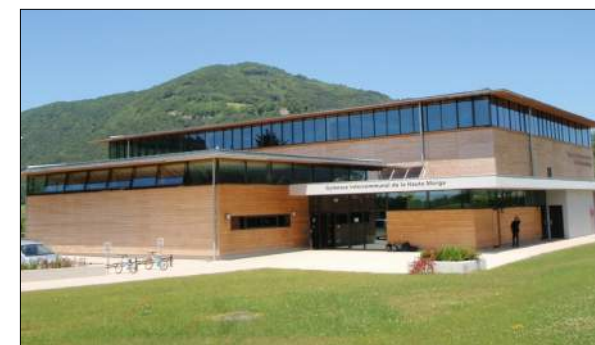
Gymnase de St Etienne-de-Crossey R2K Architectes