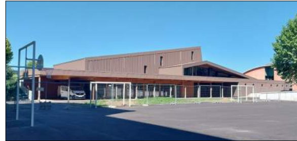
Institut Ste Marie Grand'Grange à St-Chamond AA Group

Restructuration partielle du collège (demi-pension, pôle scientifique, aménagement de l'entrée...)