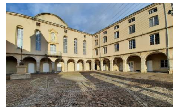
Rénovation de l'Hôtel Dieu de St-Chamond SILT