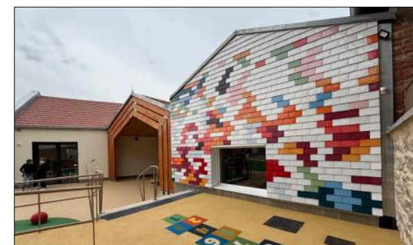
Centre de loisirs de RENAISON Equilibre Architectes