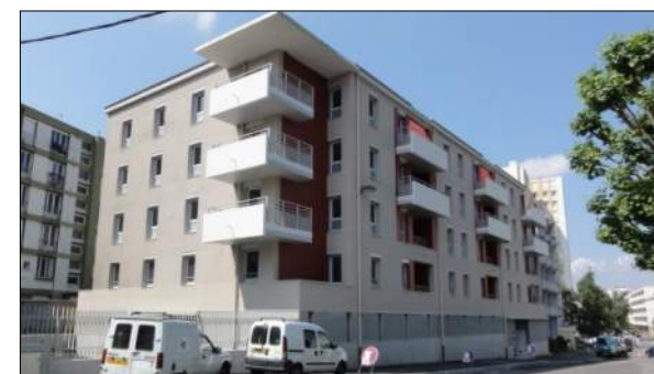
30 logements au Chambon-Feugerolles J-M DUTREUIL et J-J FERRET