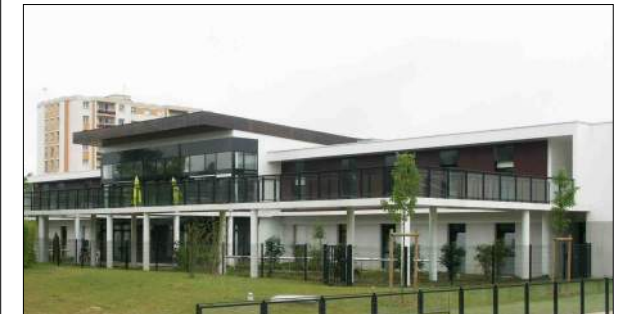
Centre Hospitalier de Blois Ivars et Ballet