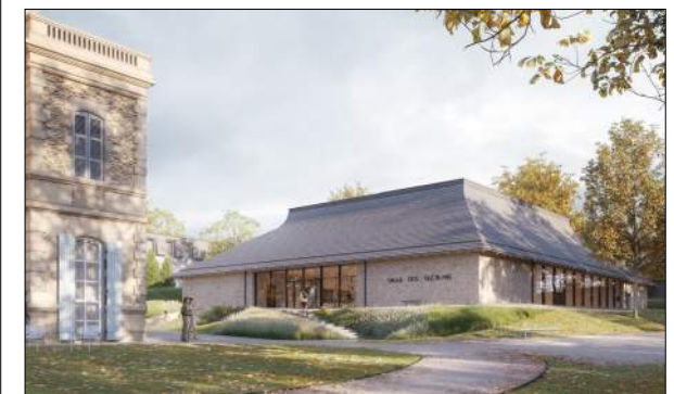
Salle des fêtes de Jassans-Riottier SILT