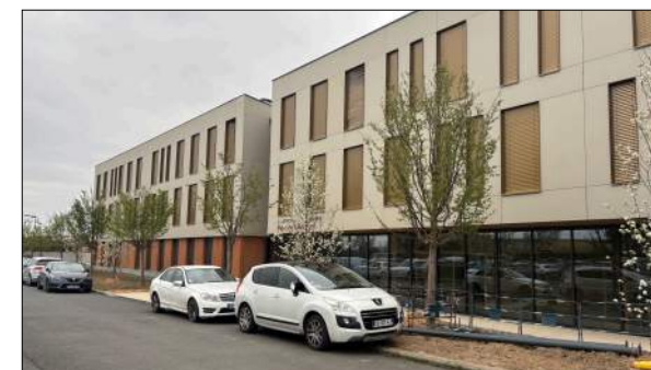
Siège communauté de communes des Pays de l'Arbresle Gallet Architecte