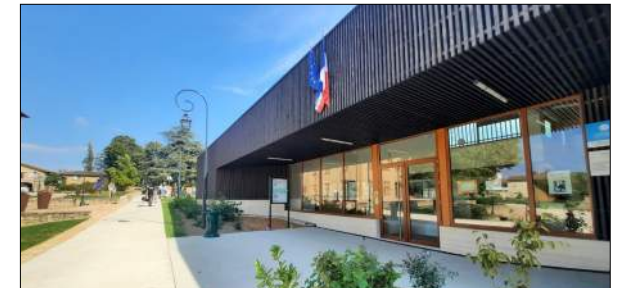
Groupe Scolaire à ARNAS PLAGES ARRIERE Architectes

Restructuration-extension de l'école élémentaire et maternelle et du restaurant scolaire Mission Archigram : Pré-programme, programme technique, assistance choix du maître d'oeuvre, ESQ, APS, APD