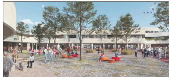
Collège Jean de la Fontaine à Roanne DOOBLE Architectes

Restructuration de l'établissement (750 élèves)