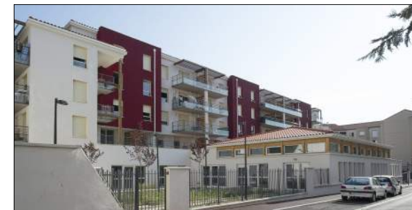
30 logements à St Chamond XXL Architecture

Résidence universitaire Condillac bâtiments A, B 672 logements en restructuration.