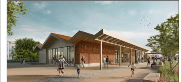
Equipement associatif + médiathèque de L'Etrat ATELIER DES VERGERS

Mission Archigram : Faisabilité, programme technique, assistance concours, assistance suivi des études