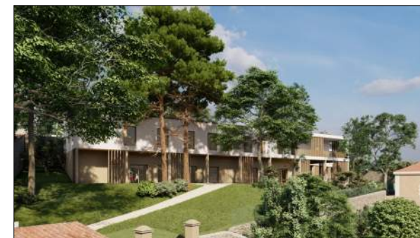
Foyer de l'enfance à SAINT-ETIENNE Kube Architecture