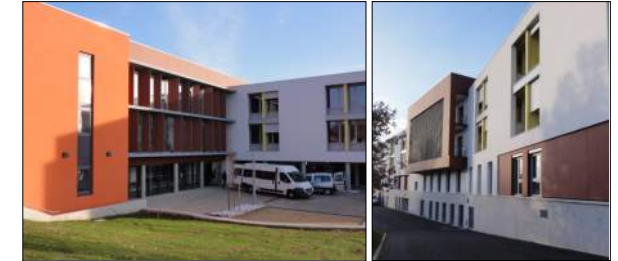
Maison de retraite de Davézieux J-L. MATHAIS Architecte