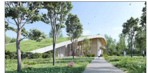
Siège de Roannaise de l'eau FOURNEL JEUDI Architectes