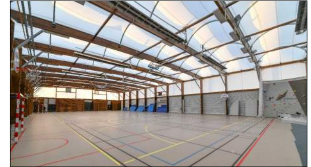
Gymnase de Annonay OLIVIER BONZON Architecte