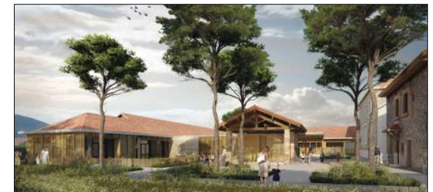
Ecole élémentaire et maternelle à Saint-Cassien NAMA Architecture