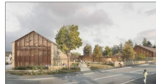
Siège communauté de communes du Haut Lignon Gallet Architecte

Mission Archigram : Etude de faisabilité