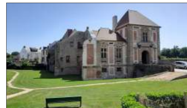
Château de Pionsat CROISEE D'ARCHI