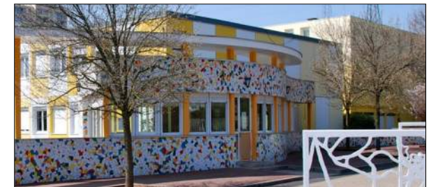
Collège Le puits de la Loire à St-Etienne BRUHAT & BOUVHAUDY Architectes

Conseil Général de la LOIRE (42) 1997 Collège G. Baty de PELUSSIN Restructuration - extension de l'établissement