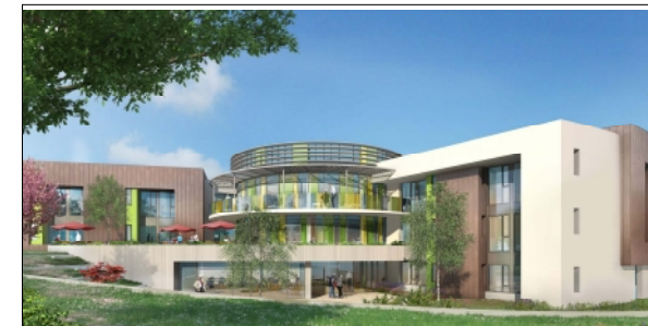
Hôpital local de Tournus SEXTANT Architecture