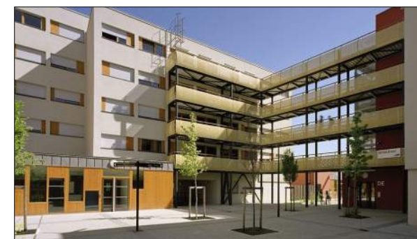
Résidence Condillac (CROUS Grenoble) FERRAND-SIGAL