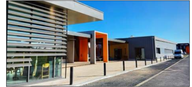
ADAPEI 63 ESAT de THIERS PERICHON - JALICON

Etude pour le réaménagement du bâtiment principal (5 niveaux) et des annexes sur un site en forte pente avec contraintes patrimoniales Mission Archigram : Etude de faisabilité et d'opportunité, programme technique