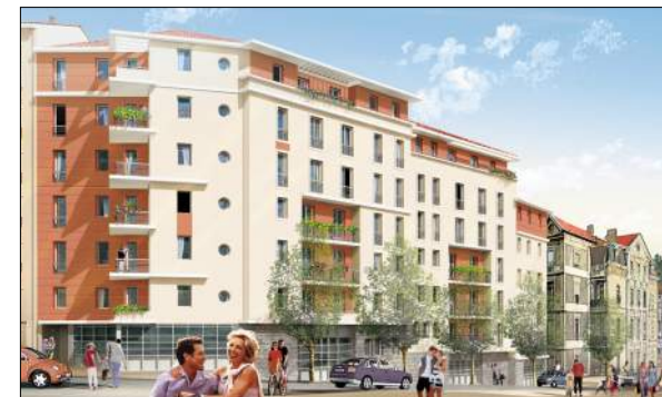
50 logements à St Chamond BERAUD Architecture Ingénierie

Construction de 8 logements rue J.J. Rousseau