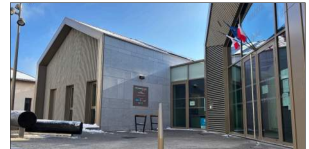
Reconstruction de la mairie de St-Christo-en-Jarez ATELIER DES VERGERS

Ville de MONTLUEL (Ain) 1993 Restructuration de la mairie au couvent de la Visitation.