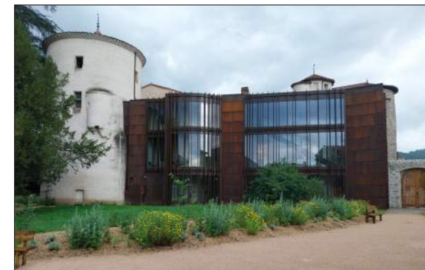
Château de Aurec-sur-Loire CROISEE D'ARCHI

Mise en valeur d'une ferme typique du Jarez (la ferme Sorlin) par la création d'un Pôle " Savoir-faire et faire savoir ".