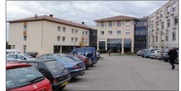
Hôpital local de Tournus HIATUS Architectes

Plan directeur du centre hospitalier : 174 lits