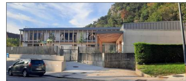
Groupe Scolaire Debelle à Voreppe BRENAS DOUCERAIN Architectes