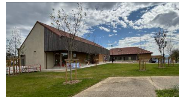
Médiathèque de Satolas-et-Bonce NAMA Architecture