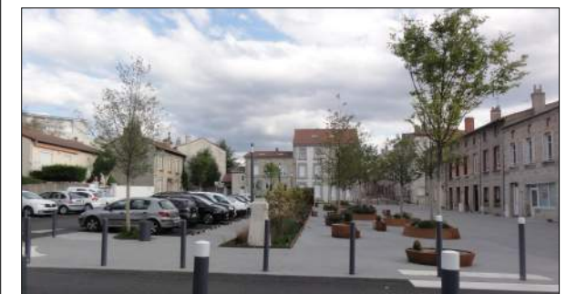
Aménagement de la Place Carnot à St Genest Lerpt