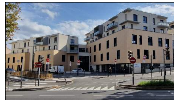
Résidence du Treyve a Saint-Etienne XXL GROUP