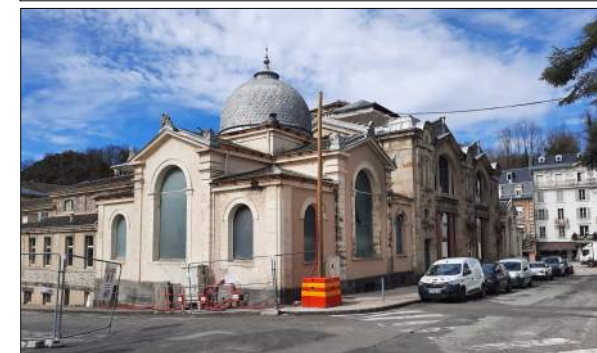
Rénovation d'une aile du bâtiment "Les Grands Thermes" à La Bourboule