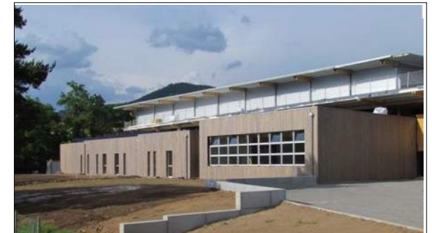
Gymnase de St Julien Chapeuil A+D+F David Fargette