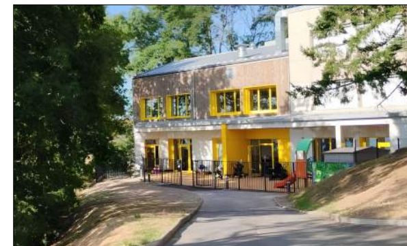
Jardin d'enfants à SAINT-HEAND Wild Architecture

Création d'un équipement social espace "entreprendre".