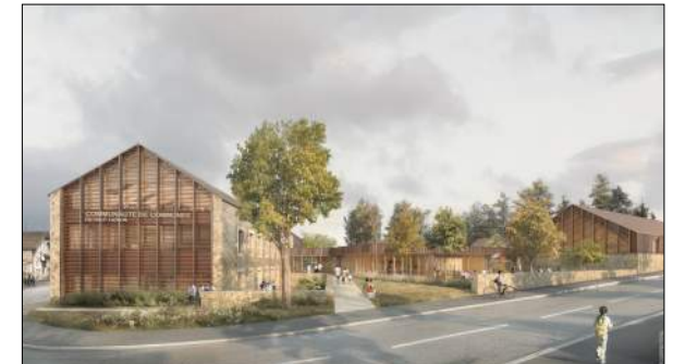
Salle des fêtes de Tence Gallet Architecte

Création d'un Pôle Départemental et d'initiation Pêche Nature sur le site de l'Etang David à ST JUST ST RAMBERT