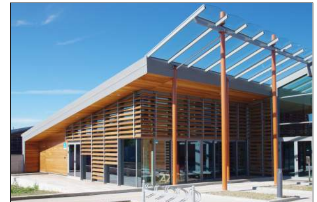
ESAT de CUSSET PERICHON - JALICON