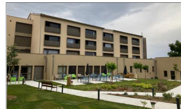
Résidence Autonomie du lac à Maclas AA Group

Restructuration restaurant du foyer "Barra"