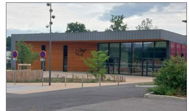
Salle des fêtes de Sury-le-Comtal Vindry Archi