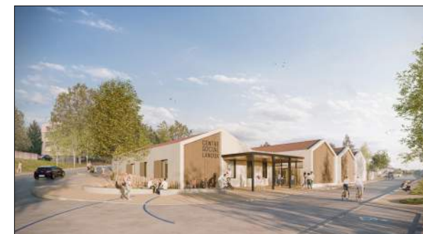
Centre social de RIVE-DE-GIER ATELIER DES VERGERS