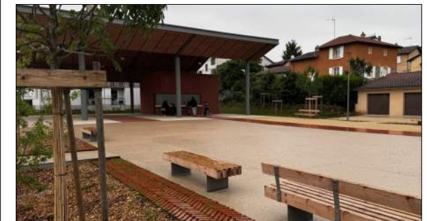
Construction d'une halle à St-Pierre-la-palud