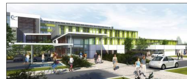
Centre Hospitalier de Vichy CRR Architectes