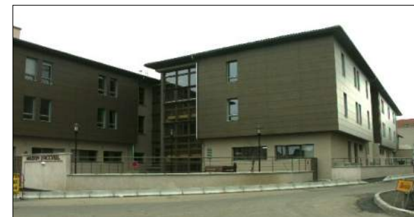
Maison de retraite de St Just St Rambert A. DUVERGER et Ph. BLANC Architectes