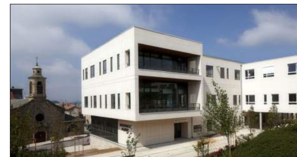
Hôpital local d'Yssingaux SUD Architectes