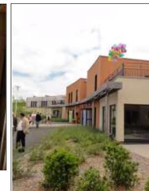
M.A.S. à Chazelles-sur-Lyon CRR Architectes