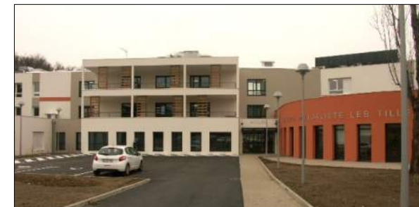
Maison de retraite de La Grand-Croix Groupement Robot-Lantermoz Gallois-Dudzick-Berger

EHPAD de 167 lits, résidence autonomie de 70 lits et 19 logements inclusifs Mission Archigram : Faisabilité SYNERGIE mandataire