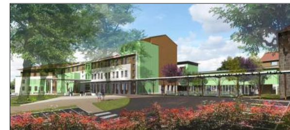
Hôpital de Moze Denis DESSUS & DORGNON

Restructuration - extension de l'établissement EHPAD 84 lits + SSR 35 lits + PASA + accueil de jour