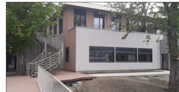
CDAT St Priest en Jarez EQUILIBRE architectes