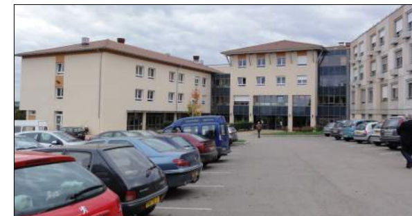
Hôpital local de Tournus HIATUS Architectes

Plan directeur du centre hospitalier : 174 lits