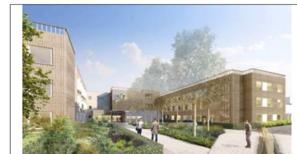
CHU St Etienne Groupement Eiffage