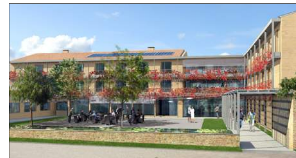
Maison de retraite de St Germain sur l'Arbresles Cabinet VURPAS