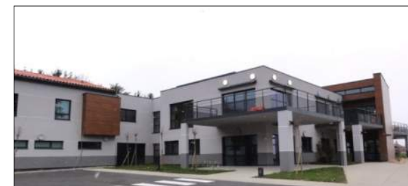
Foyer d'hébergement Le Jarezio à Saint Paul en Jarez ATLAS Architectes