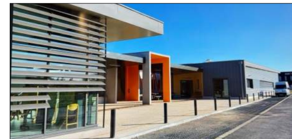
ADAPEI 63 ESAT de THIERS PERICHON - JALICON

Etude pour le réaménagement du bâtiment principal (5 niveaux) et des annexes sur un site en forte pente avec contraintes patrimoniales Mission Archigram : Etude de faisabilité et d'opportunité, programme technique