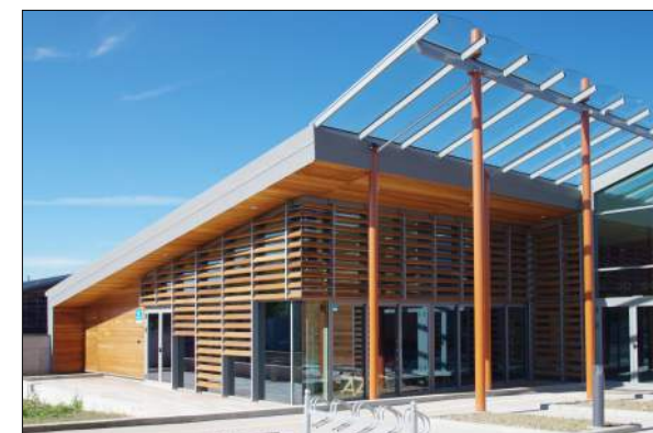
ESAT de CUSSET PERICHON - JALICON