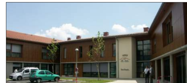
Maison de retraite de St Pal-en-Chalencon J-L. MATHAIS Architecte