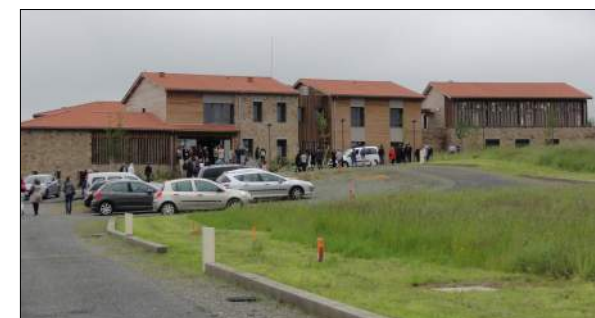
Foyer de vie à St Marcel de Félines BRUHAT - BOUCHAUDY