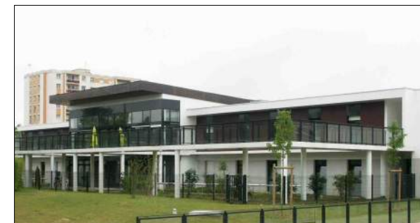
Centre Hospitalier de Blois Ivars et Ballet