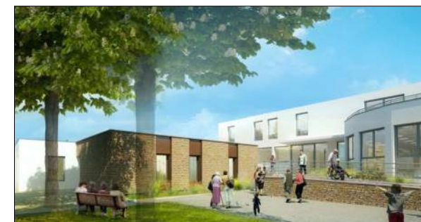
Hôpital local de Toulon sur Arroux Groupement Eiffage