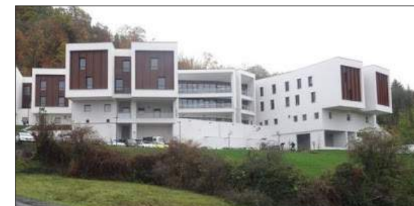
EHPAD au PUY-EN-VELAY CHABANNES