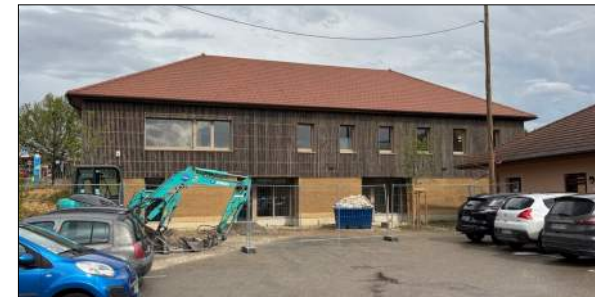
Pôle médical de SATOLAS ET BONCE NAMA Architecture

Création d'un centre d'hébergement de 25 places ou Communauté Thérapeutique pour adultes en phase de désintoxication.