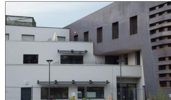
Maison de retraite de St Didier-en-Velay GENIUS LOCI Architectes

Reconstruction de l'établissement EHPAD 106 lits Mission Archigram : Pré-programme, programme, PPI