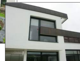
Centre Hospitalier de Blois IVARS ET BALLET Architectes