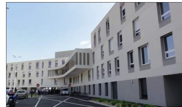
CENTRE HOSPITALIER DE CONDRIEU Groupement VINCI construction, CHABANNE et partenaires