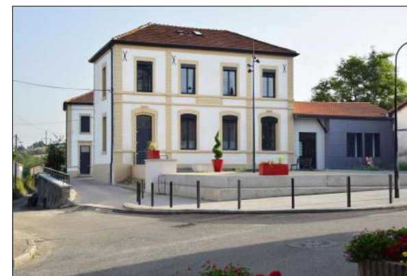
Pôle santé de REVENTIN VAUGRIS ATELIER B.A.T. architectes

Construction d'une structure d'accueil innovante regroupant un accueil de jour, un hébergement temporaire, des locaux du SSIAD et des logements adaptés, le tout pour des personnes âgées.