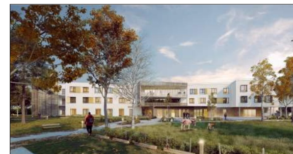
CH. Ste Foy lès Lyon - EHPAD Groupement BLB & CBXS