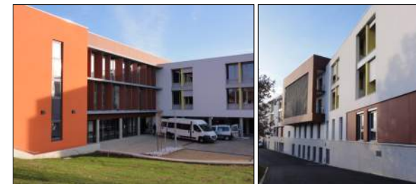
Maison de retraite de Davézieux J-L. MATHAIS Architecte