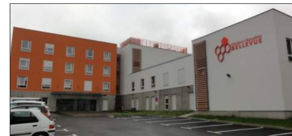
EHPAD BELLEVUE à St Etienne Groupement Eiffage Construction Loire, TECTUM, A2DH