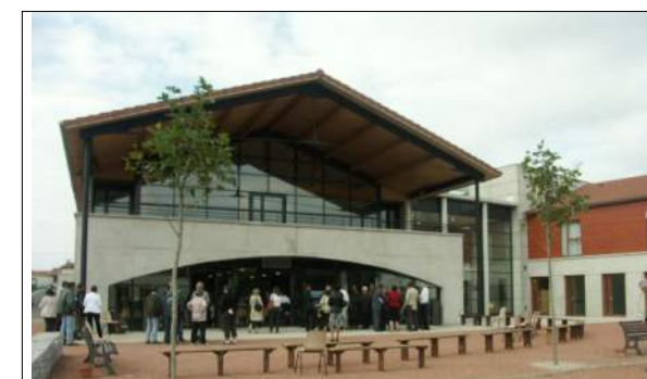
Foyer Les Mûriers à Bussières J.-L. MATHAIS Architecte