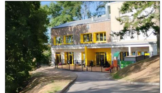
Jardin d'enfants à SAINT-HEAND Wild Architecture

Création d'un équipement social espace "entreprendre".